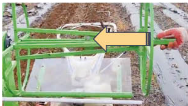
㉡ 락킹 손잡이를 화살표 방향으로 밀어서 락킹을 걸어준다.