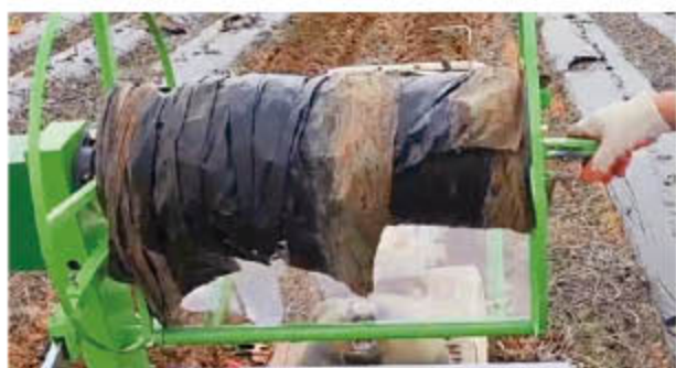
⑥ 권취량에 맞게 수거 후 관리기를 멈추고 무선 리모컨 OFF 후, 수거기에서 비닐을 제거한다.