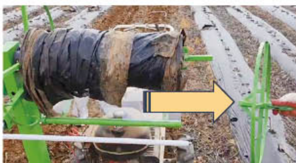
㉠ 락킹 손잡이를 누르고 화살표 방향으로 당겨서 해체를 한 후 비닐을 제거 한다.