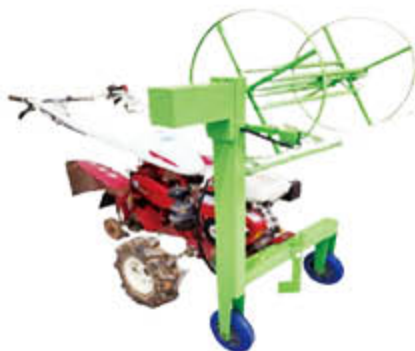
A. 관리기 배터리 있는 경우