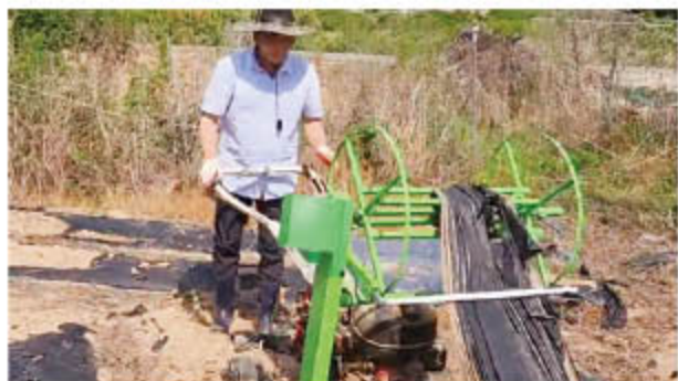
⑤ 관리기 작동 후, 적당한 속도로 수거를 실시한다.